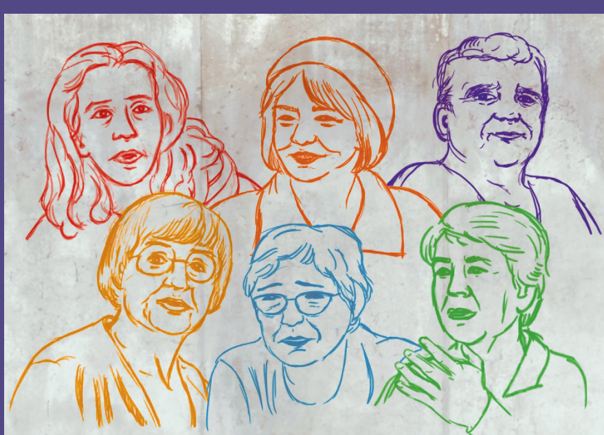
Ausschnitt aus dem Filmplakat „Übertrauen – Lesbisches KJ haben in der DDR“